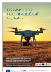
Transfer technologií bulletin